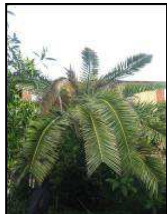
Fig. Asimmetria della chioma e appiattimento

L'esito finale dell'infestazione del punteruolo sui vegetali di palma è la morte della pianta, la cui chioma presenta tutte le foglie secche e ripiegate verso il basso, in una tipica forma ad ombrello.