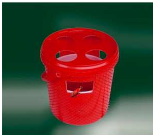
Fig. 1. Trappola a feromoni