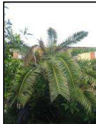
Fig. 4 Asimmetria della chioma e appiattimento

L'esito finale dell'infestazione di Rhynchophorus ferrugineus sui vegetali di palma è la morte della pianta, la cui chioma presenta tutte le foglie secche e ripiegate verso il basso, in una tipica forma ad ombrello.