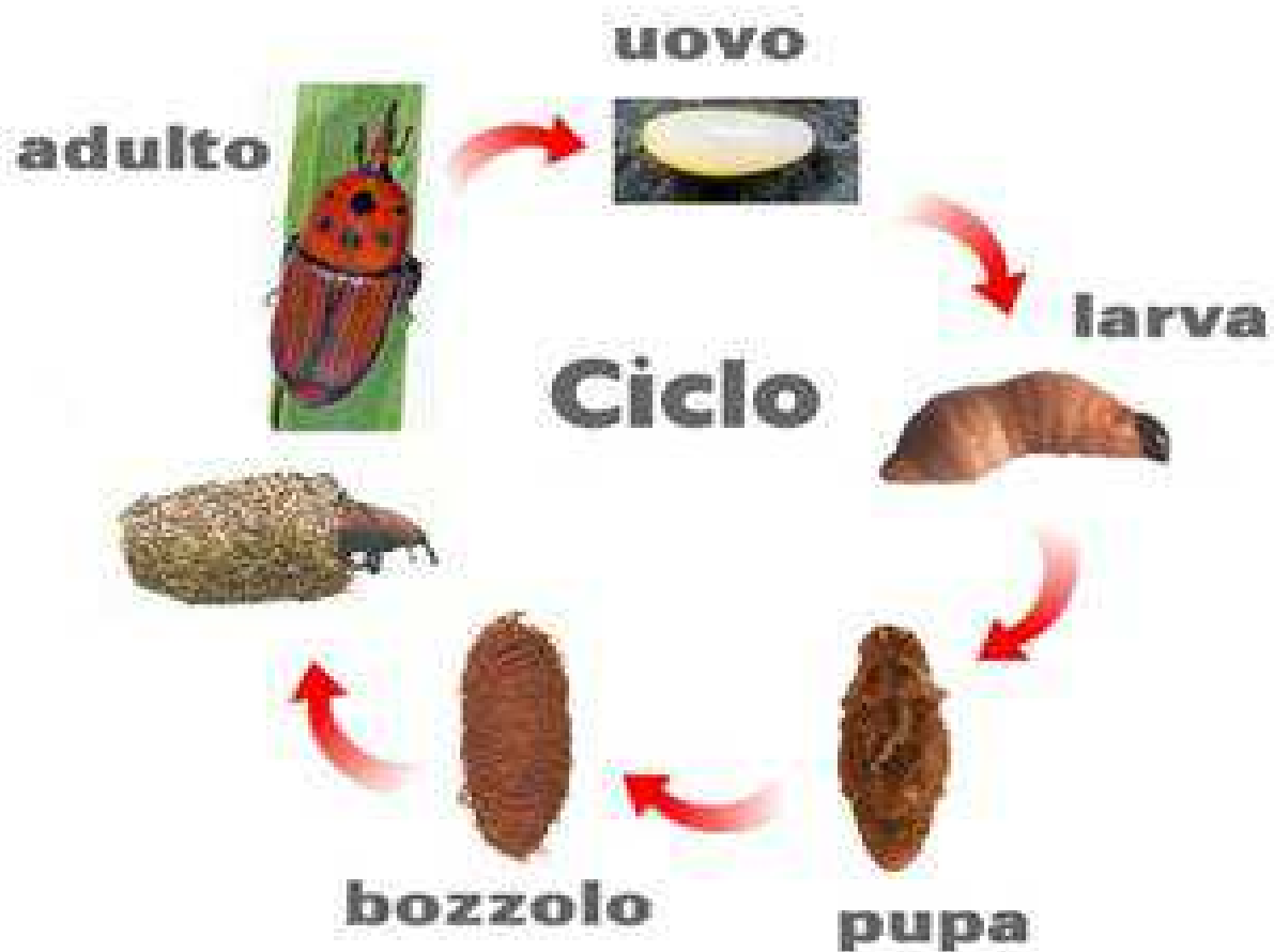
Fig. 2 Ciclo biologico del punteruolo

Negli areali di origine, caratterizzati da un clima caldo tropicale, il punteruolo rosso compie più generazioni nel corso dell'anno ognuna delle quali si completa in circa 3 mesi e mezzo. La femmina vive circa 3 mesi e depone in media 200 uova nelle ferite delle palme, dopo 2-3 gg dall'ovideposizione nascono le larve, che completano lo sviluppo in 2-3 mesi; mentre la durata del successivo stadio pupale varia da 15 a 50 giorni.